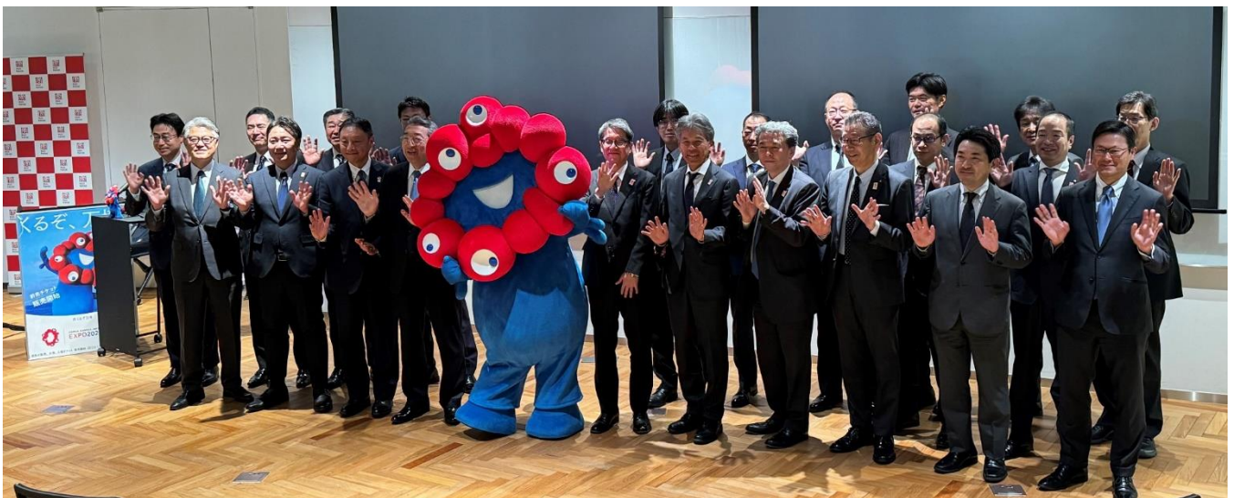
大阪連絡委員会委員の皆さんと一緒に撮影 大阪・関西万博公式キャラクター ミャクミャク

この日の説明会には、同委員会の大阪連絡委員会委員 22 名(関西地区の三菱グループ 22 社トップ、一部代理者を含む)が参集する中、三菱未来館の施主・設計者・施工者等の代表者 4 名が登壇し、挨拶と現状の説明を行いました。