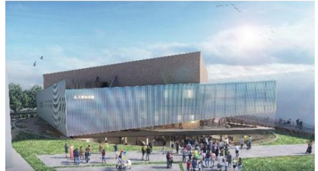
パビリオン外観イメージ

建築設計コンセプト：生命・地球・人間のつながり 敷地面積：約3,500㎡、延床面積：約2,100㎡ 構造・規模：鉄骨作り、一部木造 建物設計：三菱地所設計 建設施工：竹中工務店・南海辰村建設・竹中土木共同企業体 建築着工：2023年7月(竣工2024年10月) 展示内装工事：2024年10月～12月 展示設計：電通・電通ライブ 展示スタイル：体感シャトル型シアター※ ※プレショー、メインショー、ポストショーの3部構成 圧倒的リアリティ・迫力・スピード感・浮遊感を来館者 全員が共有する非日常体験シアター