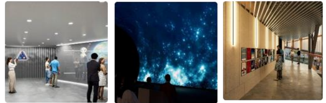
プレショー・メインショー・ポストショー イメージ